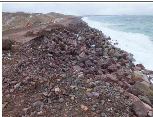
Effondrements amont (digue)