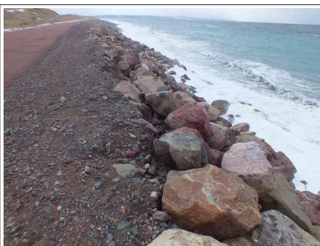
Glissement des enrochements effondrement central