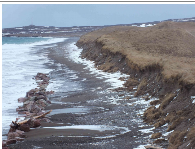
Disparition de l'extrémité du cordon