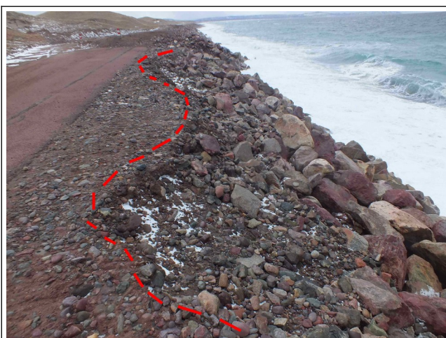
Début d'effondrement central