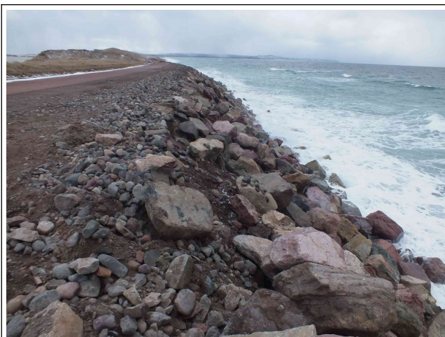
Effondrement sur la zone du parking amont